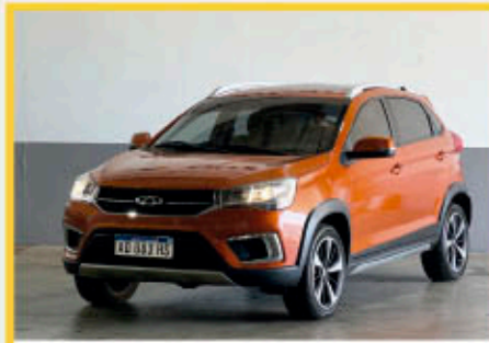
CHERY TIGGO 2 LUXURY