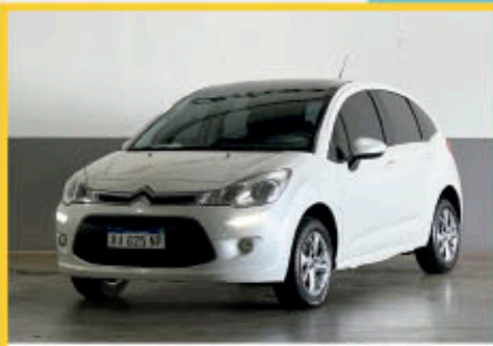
CITROEN C3 FEEL